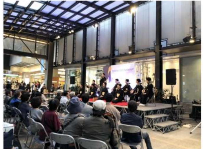
JR新宿駅 改札口前「和を伝えるプログラム」長唄演奏と和楽器体験ワークショップ