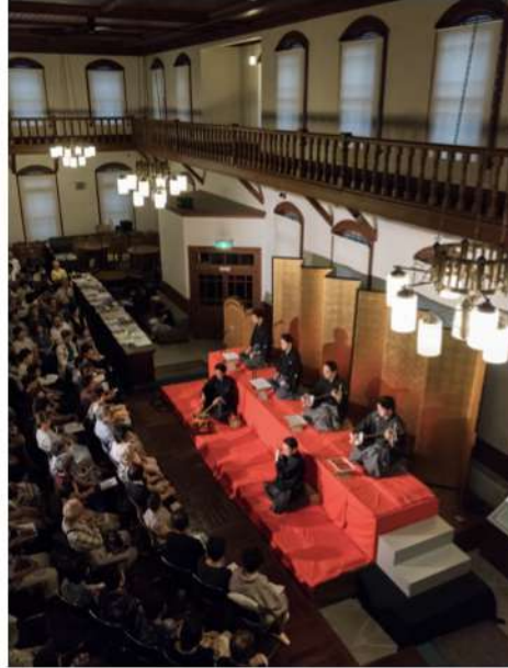
佐賀県・浪漫座コンサート