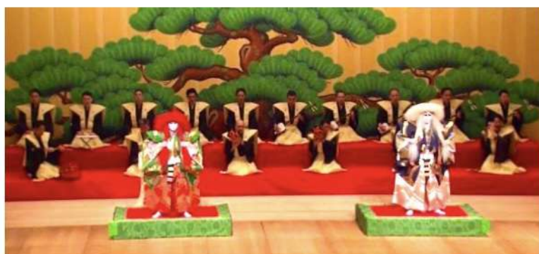
長唄「連獅子」 歌舞伎座