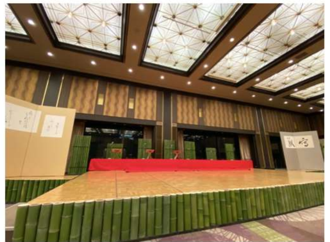
名古屋・キャッスルホテル パーティー演奏