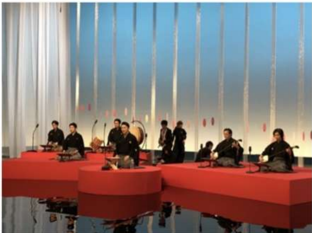
NHK にっぽんの芸能 テレビ収録