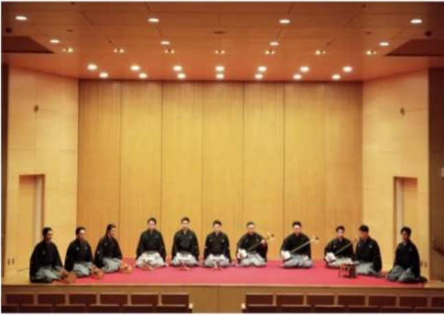
東京都美術館 外国人向けイベント