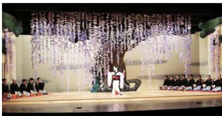
長唄「藤娘」 スペイン・カナル劇場