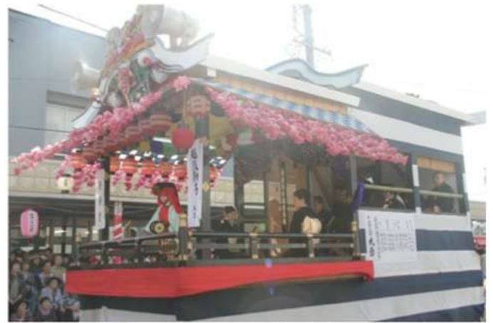
静岡県・島田大祭 屋台での演奏