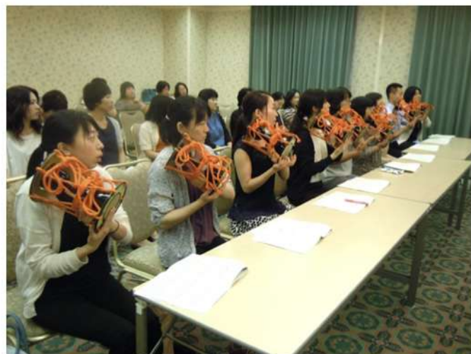
音楽教員向け研修会