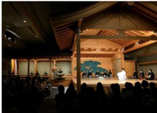
渋谷セルリアンタワー能楽堂