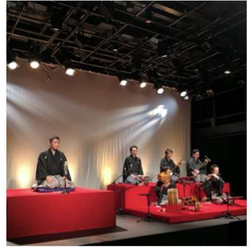
浅草九劇 落語と長唄の競演