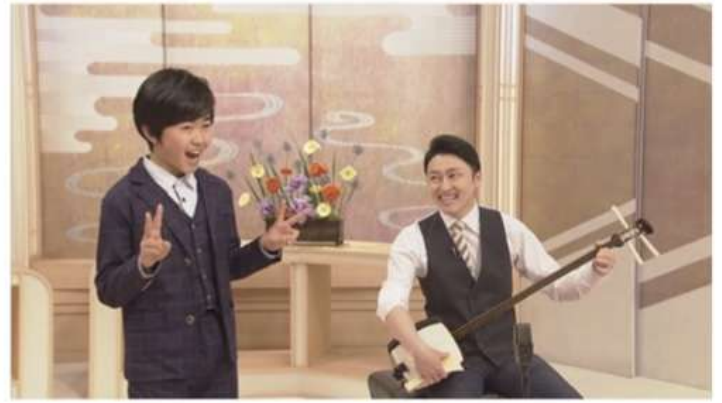
NHK にっぽんの芸能 スタジオ演奏