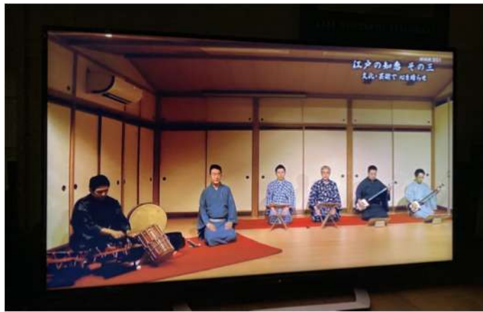
NHK BS1スペシャル テレビ収録