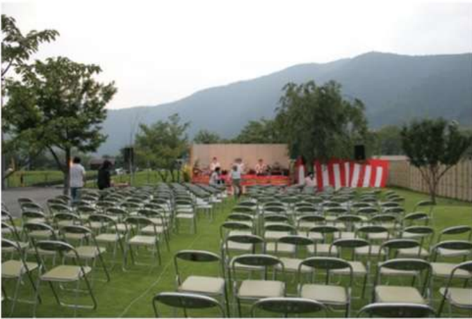
静岡県島田市・野外コンサート