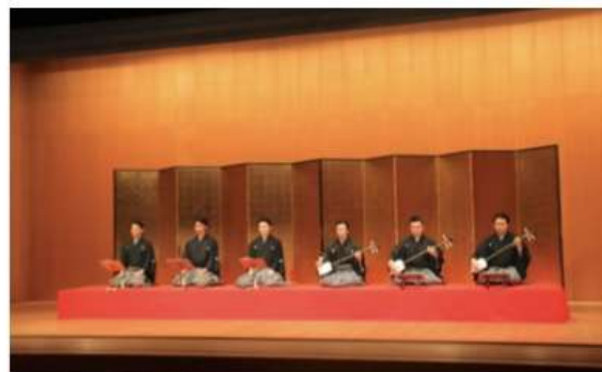
緋毛氈・金屏風 3挺3枚 囃子ナシ