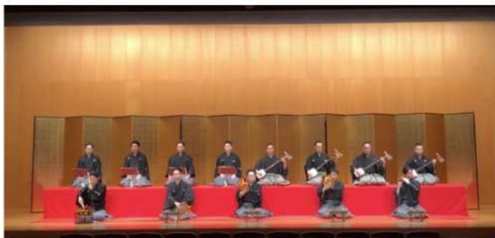
緋毛氈・金屏風 4挺4枚 囃子入