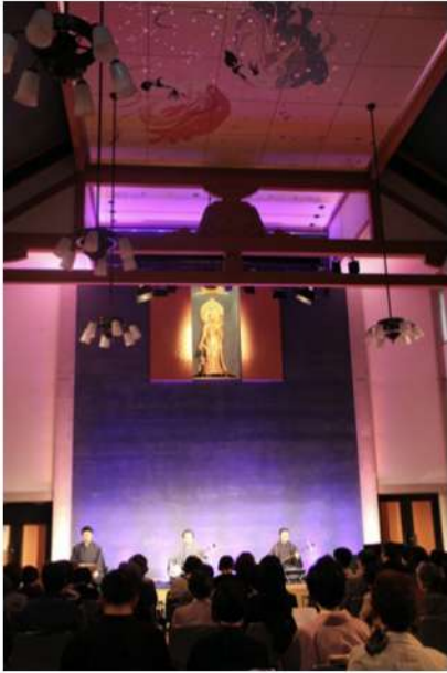
港区・青松寺 観音堂