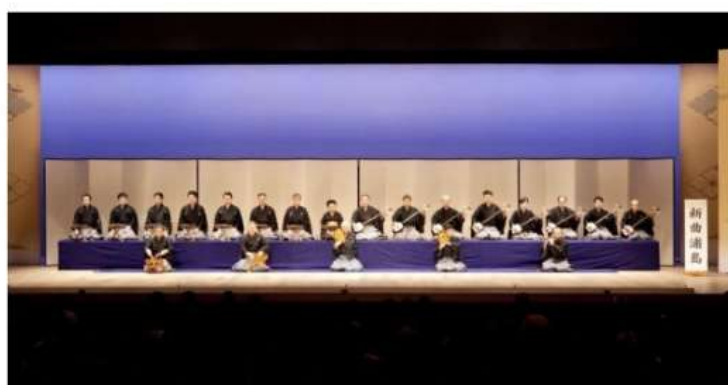
紺毛氈・鳥の子屏風 8挺8枚 囃子入 (歌舞伎座)