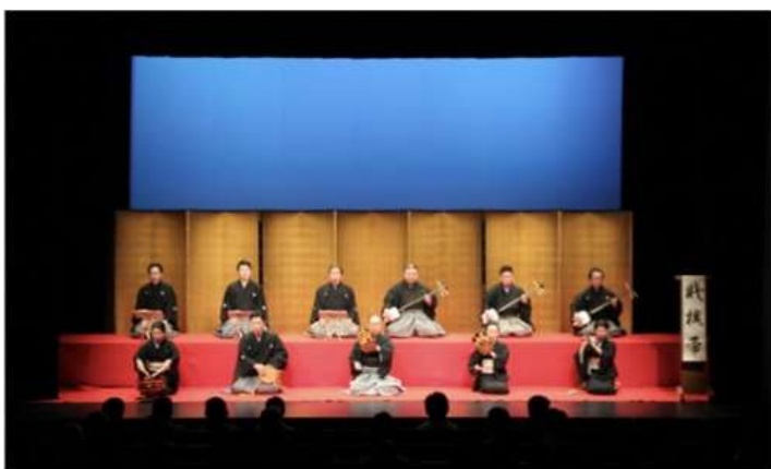
緋毛氈・金屏風 ホリゾント青 3挺3枚 囃子入