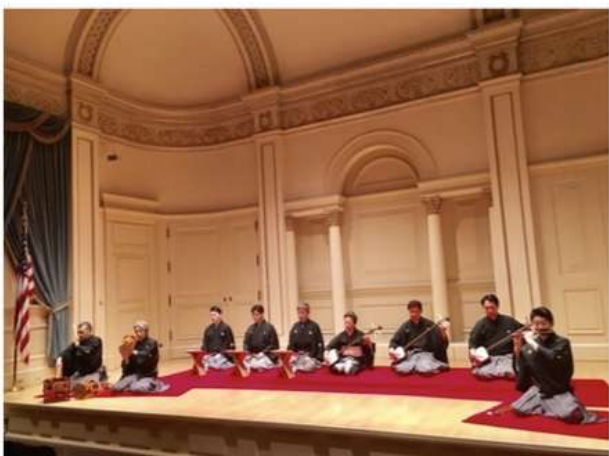
NY・カーネギーホール 長唄演奏会