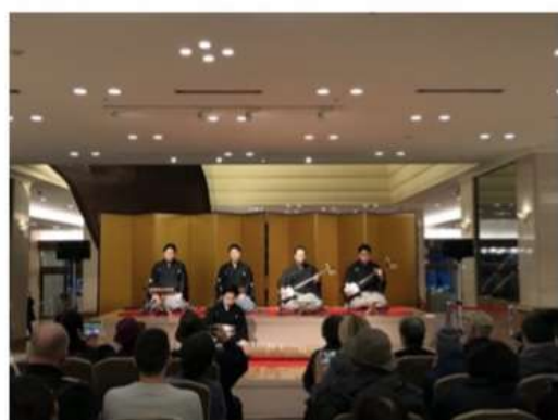
新宿・京王プラザホテル