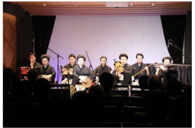
神楽坂 GREE 長唄・囃子LIVE