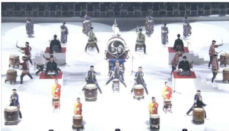
横浜アリーナ 玉川学園創立90周年式典