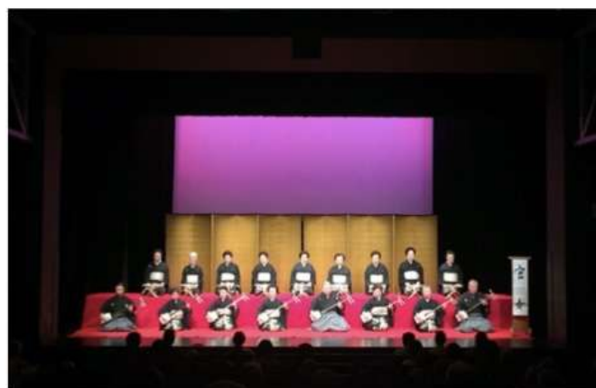
緋毛氈・金屏風 ホリゾントピンク