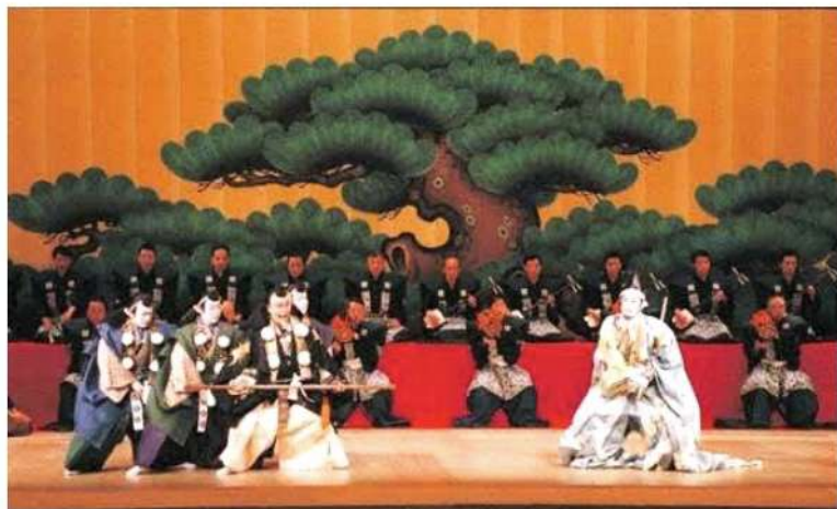
長唄「勸進帳」 国立劇場