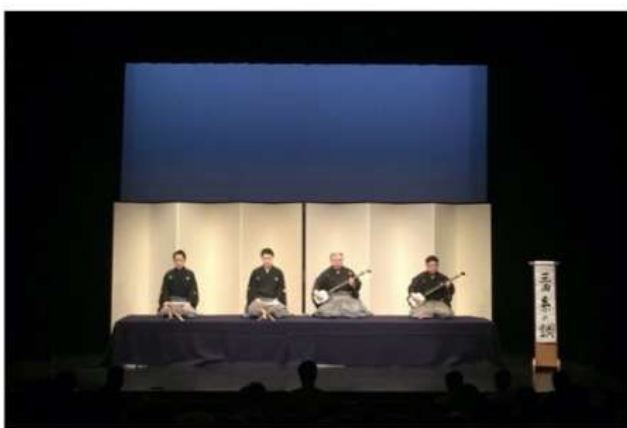
紺毛氈・鳥の子屏風 ホリゾント紺 2挺2枚